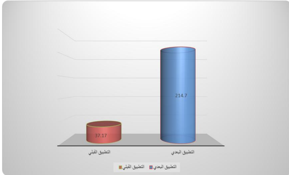
شكل (٢) متوسط درجات الطلاب في التطبيق القبلي والبعدي لبطاقة ملاحظة الجانب الآدائي المرتبطة ببعض مهارات صيانة أجهزة العرض

ملاحظة الجانب الآدائي المرتبطة ببعض مهارات صيانة أجهزة العرض: